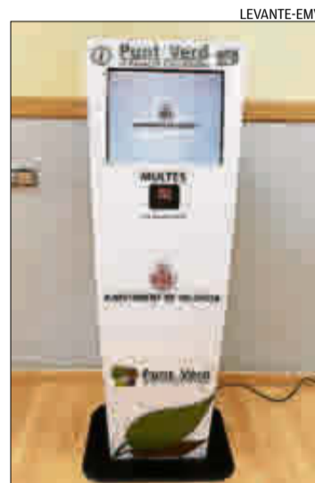
El nuevo punto verde.

A través de este terminal electrónico los ciudadanos pueden realizar pagos «de manera sencilla y segura», señalan fuentes del ayuntamiento, como cuando se hace una compra por internet, sin tener que hacer colas para ser atendido. El punto verde dispone de un lector de código de barras integrado que permite introducir los datos del documento más fácilmente. La pasarela bancaria pide los datos de la tarjeta para hacer efectivo el pago y se encarga de realizar todas las validaciones